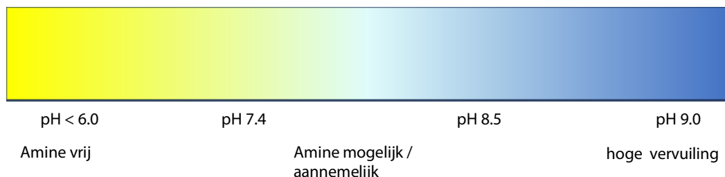
TQC Sheen Amine Blush kit kleurverloop*

* Werkelijke kleur kan afwijken door hoeveelheid gebruikte testvloeistof en lichtomstandigheden